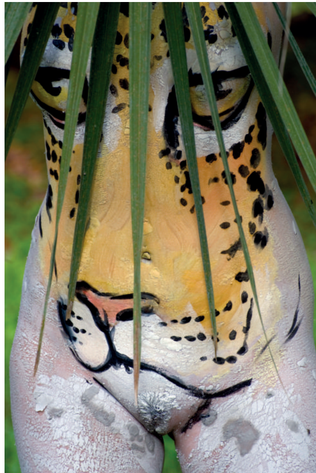
Arriba, la imagen del jaguar que sirvió de inspiración. Enseguida, Balam 1 , pintura y fotografía de Patricio Robles Gil, 2009.

—enfocadas principalmente en demostrar cómo las tierras silvestres son nuestro mejor aliado para enfrentar la crisis ambiental del planeta—, el espíritu del congreso estuvo reafirmado por las representaciones de arte y cultura como parte de la solución ambiental.