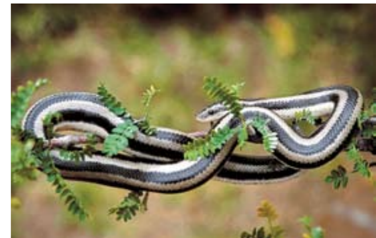
Boa rosada, Sierra La Giganta, Baja California Sur