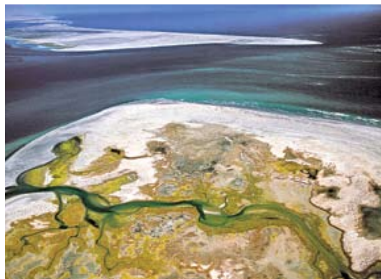
Estero La Bocana en Laguna San Ignacio, El Vizcaíno B.C.S. Vista aérea