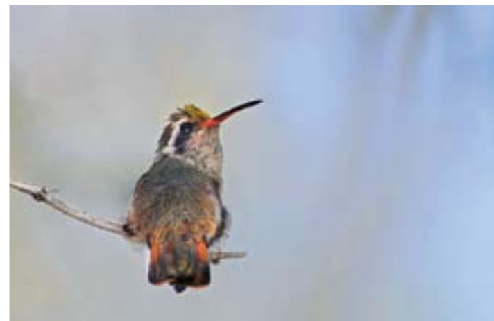
Colibri de Xantus con polen en las plumas de su cabeza, en la Sierra de la Giganta, Baja California Sur