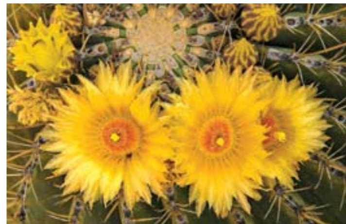
Flor de biznaga en la Sierra de Guadalupe, Baja California

“La geografía de la esperanza”... He atesorado mentalmente ese concepto durante décadas, sobre todo cuando, como ambientalista, me ganaba la desesperación al ver ecosistemas naturales sucumbir bajo la depredación de corto plazo, siempre bajo el argumento del desarrollo: acuíferos agotados, selvas taladas, laderas erosionadas, lagunas costeras dragadas, arrecifes deteriorados, pesquerías colapsadas.