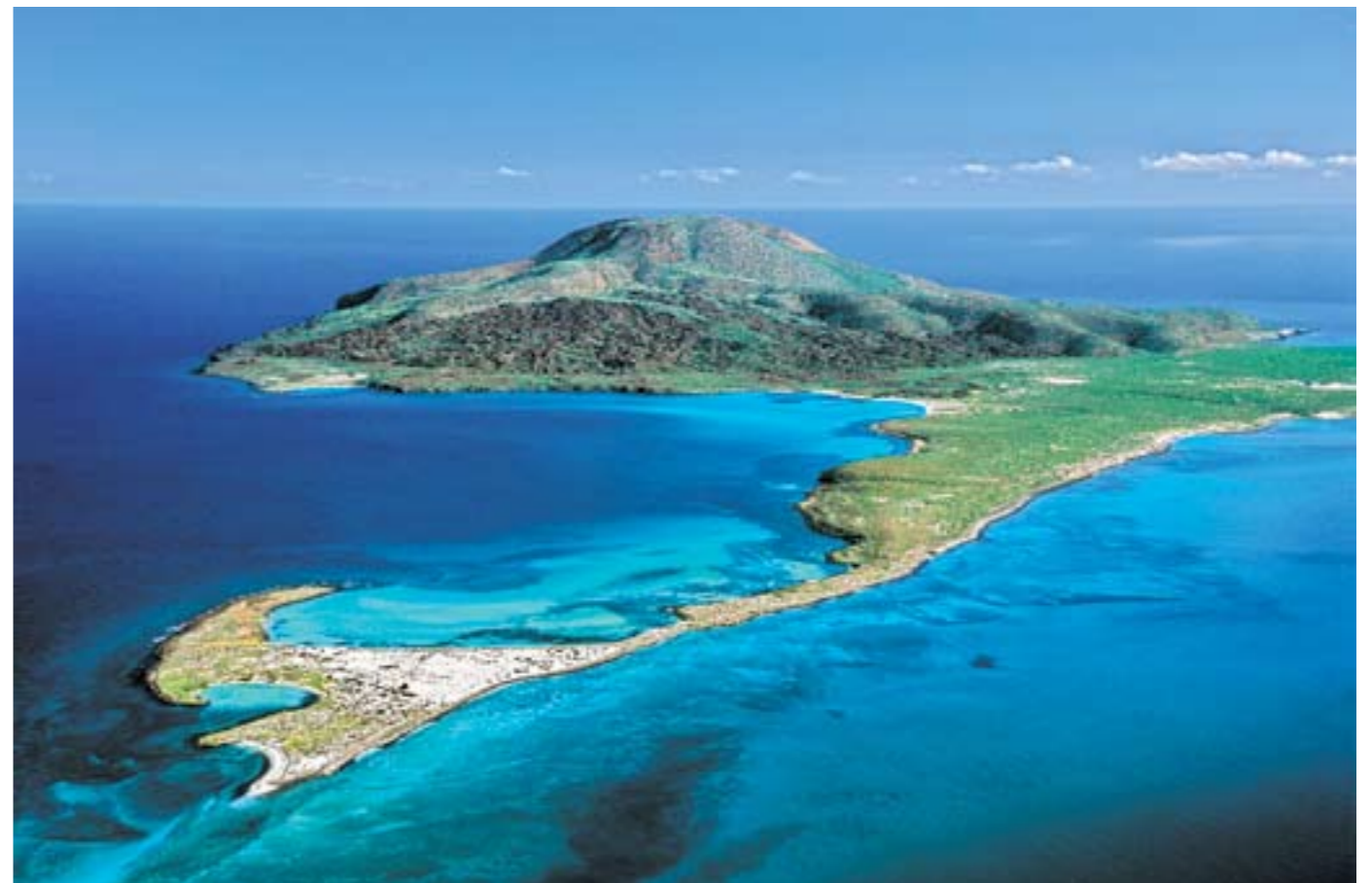
Isla Coronado, Parque Marino Nacional Bahía de Loreto, Baja California Sur