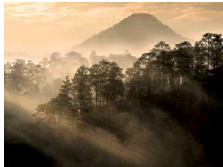
Amanecer en el bosque mesófilo, Reserva de la Biosfera La Sepultura, Chiapas