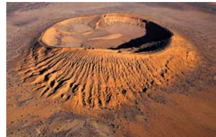
Vista aérea del cráter del Cerro Colorado en la Reserva de la Biosfera El Pinacate y Gran Desierto de Altar, Sonora