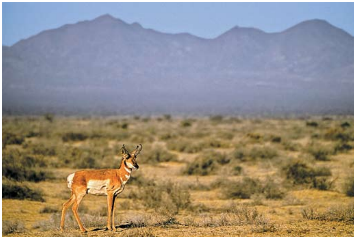
Berrendo en la Reserva de la Biosfera El Vizcaíno, con la sierra San José de Castro al fondo

en el suelo en forma de materia orgánica; nos brindan protección para nuestras costas y estuarios frente al ascenso del nivel del mar y la creciente frecuencia de fenómenos climáticos extremos.