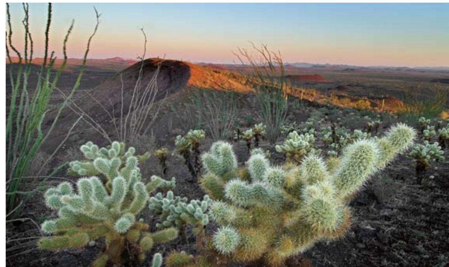
Salida del sol en la cumbre del cráter Tecolote, Reserva de la Biosfera El Pinacate y Gran Desierto de Altar, Sonora