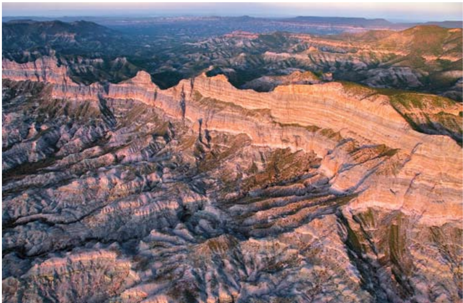
Estribaciones de Sierra de La Giganta, Baja California Sur

LOS DE MI GENERACIÓN CRECIMOS CON UN PARADIGMA que orientó nuestro pensamiento durante décadas: el de las tierras ociosas. En un mundo donde hay hambre y carencias, aprendimos, ¿cómo justificar mantener tierras alejadas de la producción? Durante mi adolescencia y mi juventud, el desmonte, el avance de las fronteras agrícolas, y la expansión urbana sobre bosques y selvas, eran sinónimo de progreso, de pujanza, de un crecimiento económico que traería tras de sí una mayor riqueza y una mejor justicia distributiva. Las tierras silvestres estaban allí, dictaba el pensamiento dominante de entonces, para nuestro progreso como sociedad. Era sólo necesario conservar algunas pocas en estado natural para el goce de cazadores o el disfrute de campistas y exploradores aficionados. Lo demás, era parte del progreso, parte del desarrollo del México moderno.