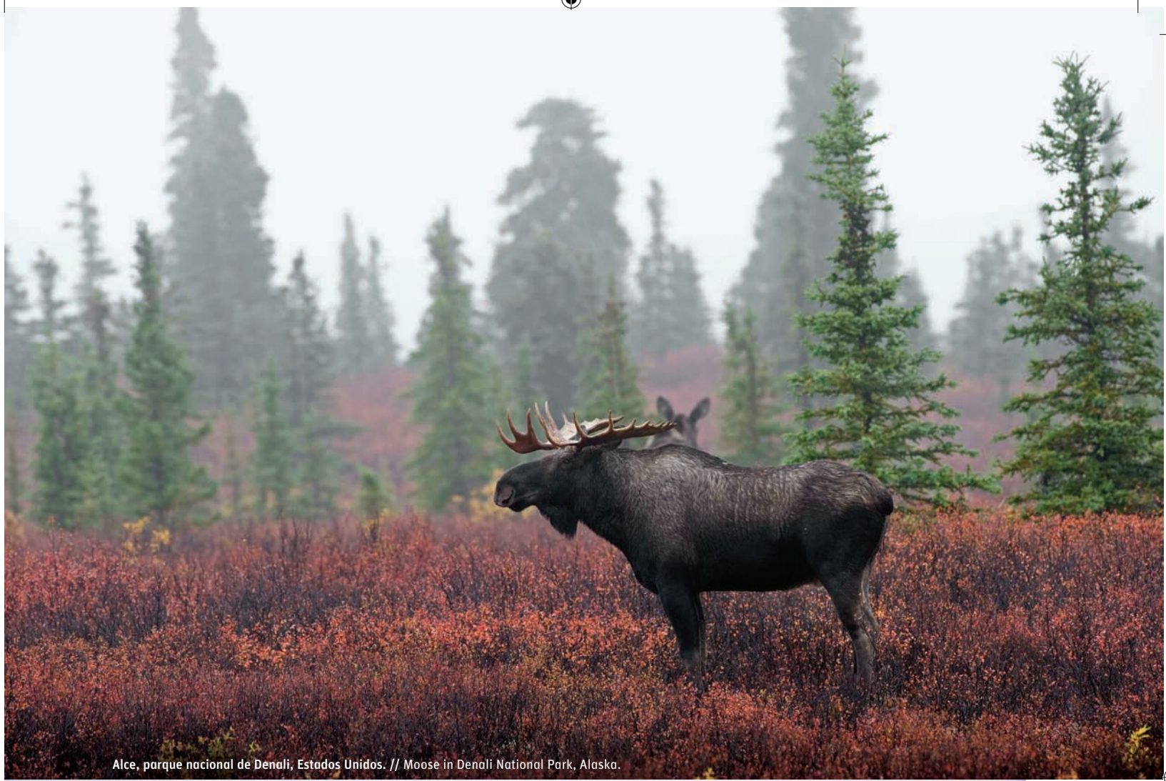
Alce, parque nacional de Denali, Estados Unidos. // Moose in Denali National Park, Alaska.