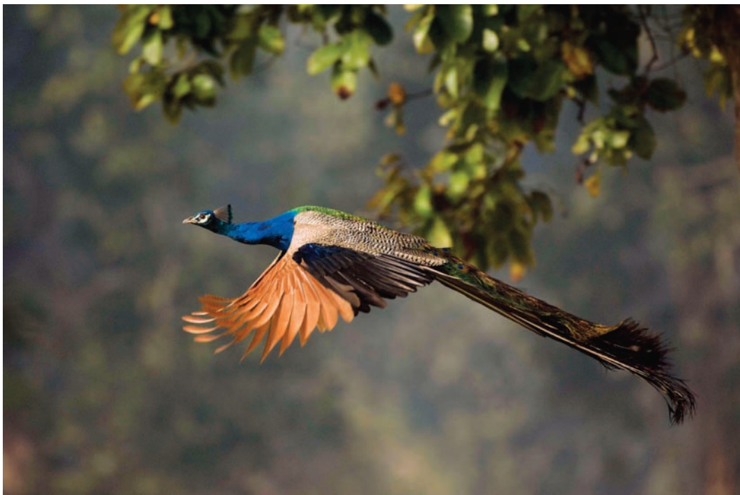
Pavo real en vuelo, parque nacional de Chitwan, Nepal. // Indian peacock in flight over Chitwan National Park, Nepal.