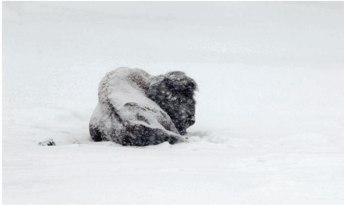
Bisonte americano, parque nacional Yellowstone, Estados Unidos. // An American bison in Yellowstone National Park.

La palabra inglesa wilderness no tiene traducción al castellano y los intentos por desentrañar su significado carecen de fuerza, lo que es interesante si consideramos el profundo vínculo que existe entre cada ser humano y la primitiva esencia de tal término. ¿Cómo acuñar en habla hispana una expresión para referirnos al entorno que fue la cuna de nuestra especie? ¿Cómo dibujar con letras la naturaleza primigenia que nos cobijó por milenios? Este dilema es una señal clara de nuestro abandono a ese mundo. Por lo tanto, ¿a qué se refieren los naturalistas extranjeros al usar la palabra wilderness ? Es un concepto muy personal y subjetivo de aquellos que han tenido el privilegio de vivir un tiempo en un territorio natural, prístino, salvaje o silvestre.