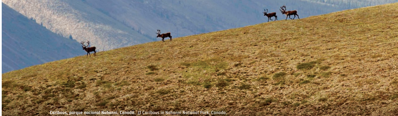
Caribous, parque nacional Nahanni, Canadá. // Caribous in Nahanni National Park, Canada.

WILDERNESS MEANS NATURAL SPACES WHERE NO FOOTPRINT OF INDUSTRIAL CIVILIZATION IS FOUND AND HUMAN ACTIVITIES HAVE LEFT NO EVIDENCE BEHIND.