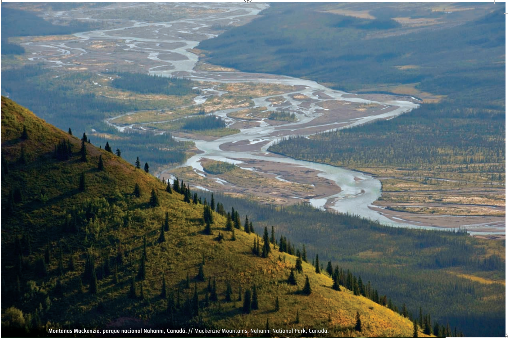
Montañas Mackenzie, parque nacional Nahanni, Canadá. // Mackenzie Mountains, Nahanni National Park, Canada.