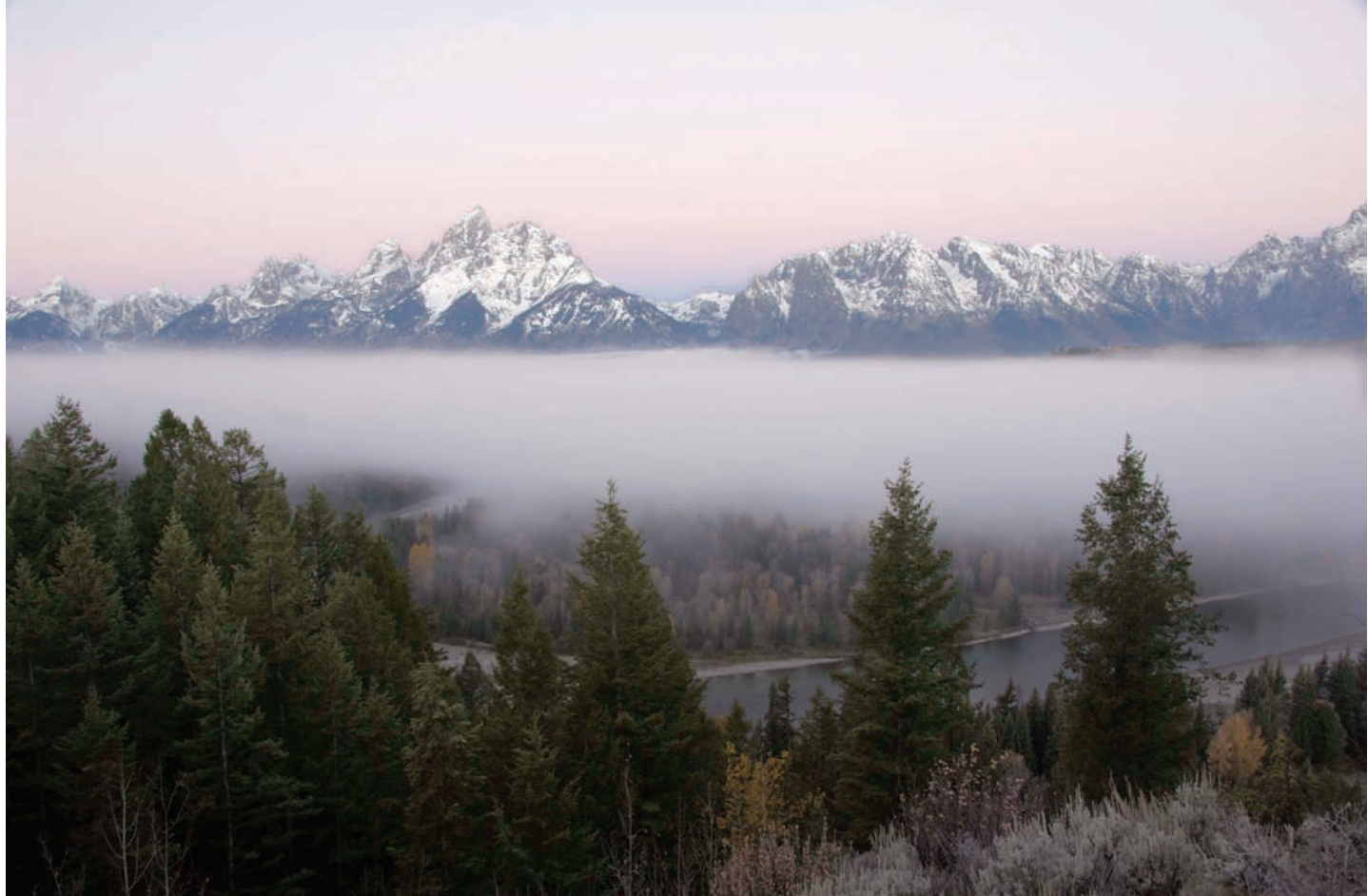
Río Snake, parque nacional de Gran Teton, Estados Unidos. // Snake River, Grand Teton National Park, Wyoming.