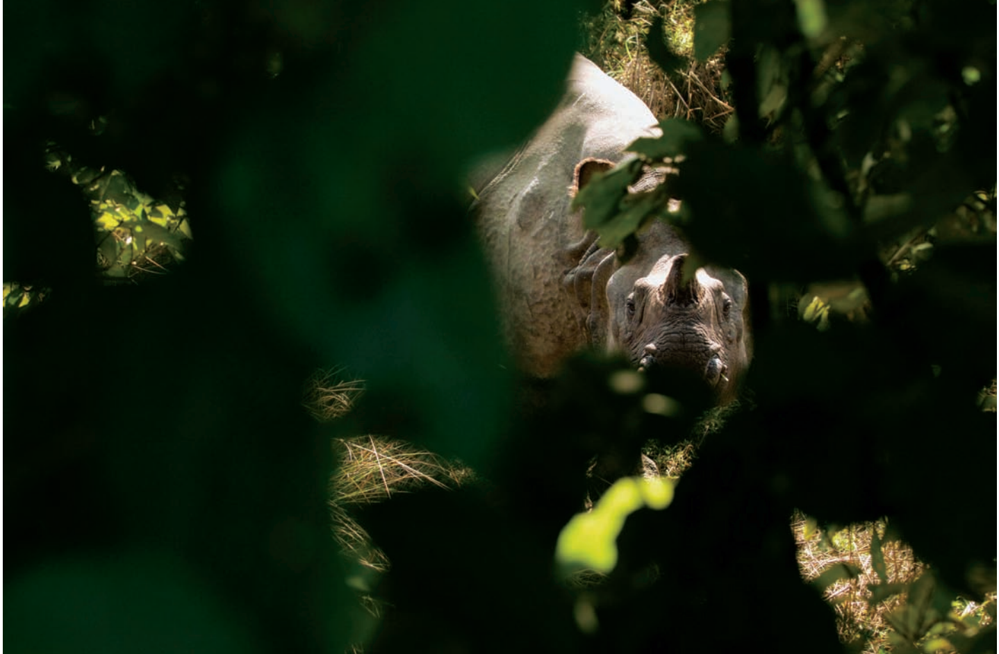
Rinoceronte de la India, parque nacional de Chitwan, Nepal. // An Indian rhino in Chitwan National Park, Nepal.