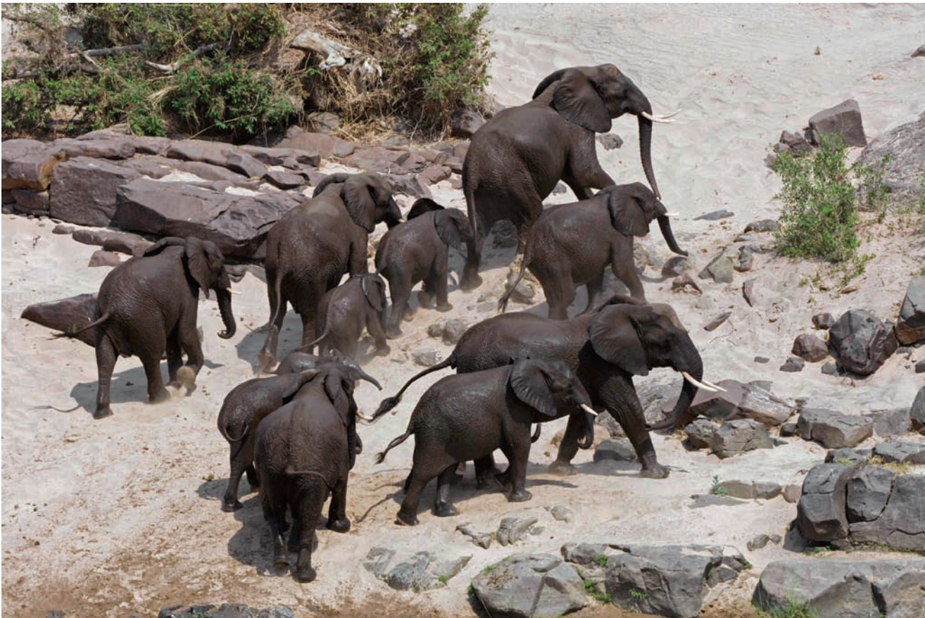
Elefantes africanos, parque nacional Kruger, Sudáfrica. // African elephants in Kruger National Park, South Africa.

The program is ongoing, and year in and year out, in whatever wilderness area the treks take place, all people involved unanimously report that, “After the first couple of days, I felt at home.” What a testimony this is to our continuing relationship with wild nature, where we spent thousands of years in evolution. We must not permit the gulf that has come between nature and society to cause us to forget our original home, the wilderness.