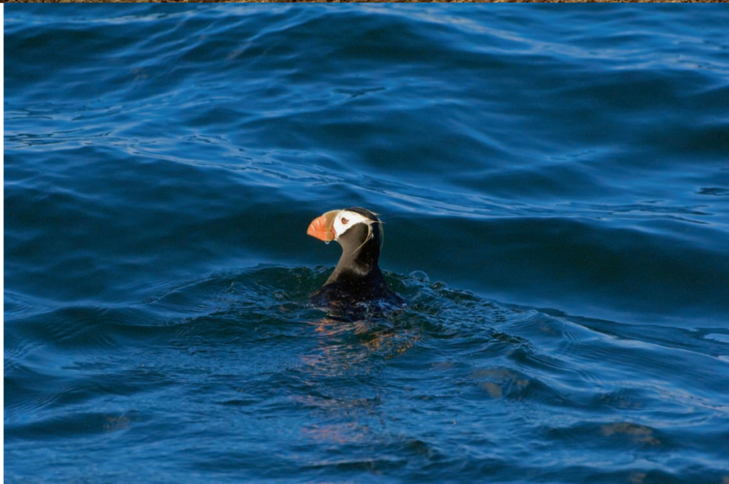
Frailecillo crestado, Mar del Norte, Kamchatka, Rusia. // A tufted puffin in the North Sea, Kamchatka, Russia.